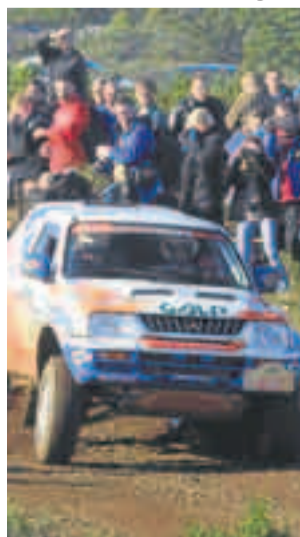
Rally en Boyacá en mayo. ADN

Inscripciones: 310 349 2878, 614 7354; www.ruedalibrecolombia.com